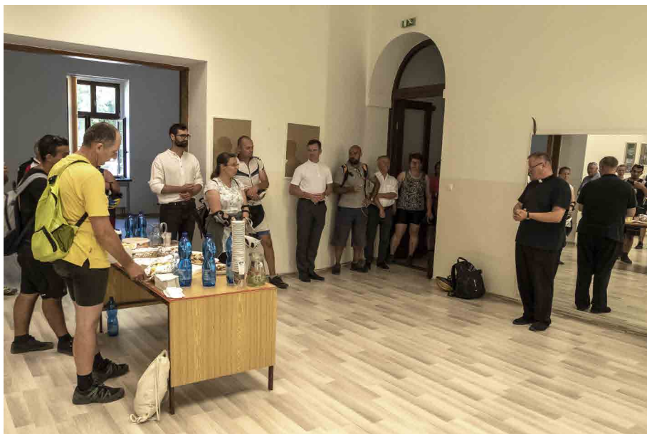
Občerstvenie pre cyklistov v pastoračnom centre pripravila farnosť Močenok.