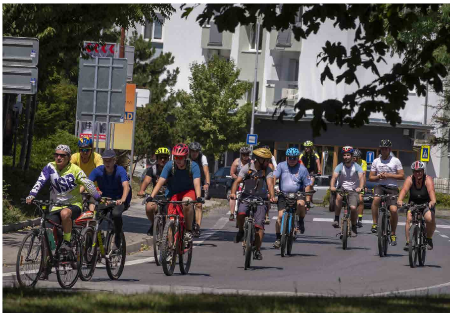
Niekoľko krátkych úsekov v Šali viedlo po štátnych cestách.