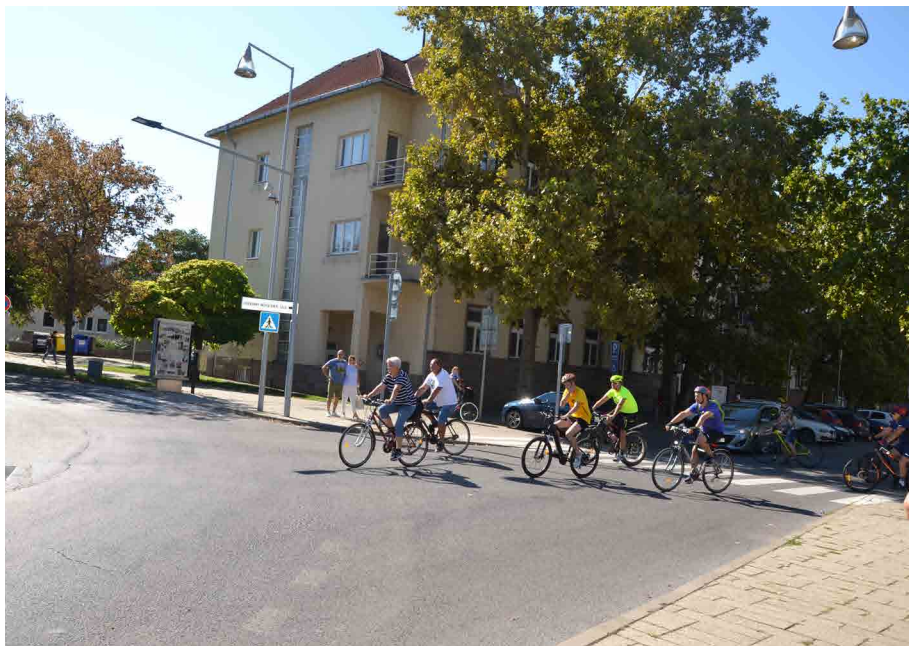
Z mestského úradu cyklisti vyrazili po ulici Petra Pázmáňa do Veče a potom na cyklochodník smerom k Duslu.