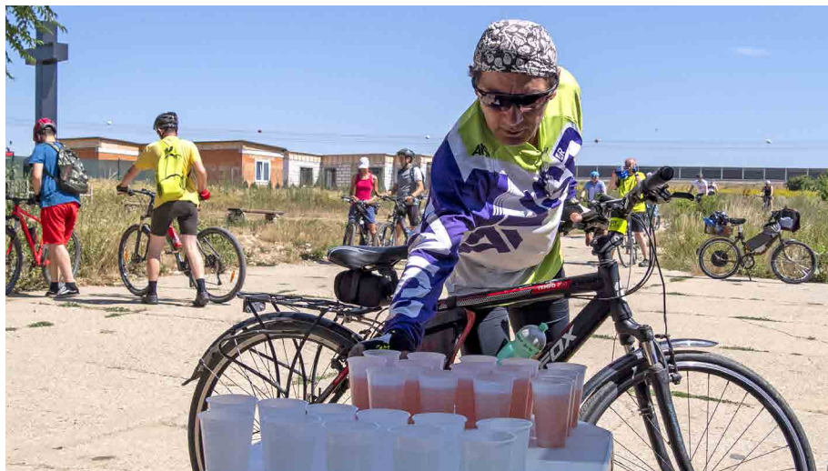
Občerstvenie pri odbočke na Párovské háje pripravili cyklisti zo Sale.