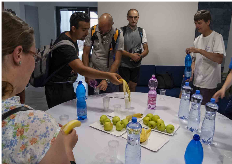
Mesto Šaľa zabezpečilo občerstvenie na mestskom úrade.