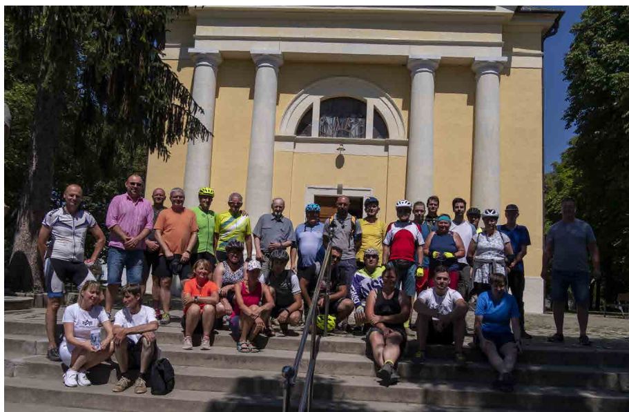
Súčasťou podujatia bola prehliadka Kostola sv. Margity Antiochijskej v Šali.