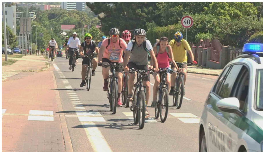
Cyklistov pri výjazde z Nitry preverilo prevýšenie v mestskej časti Čermáň.